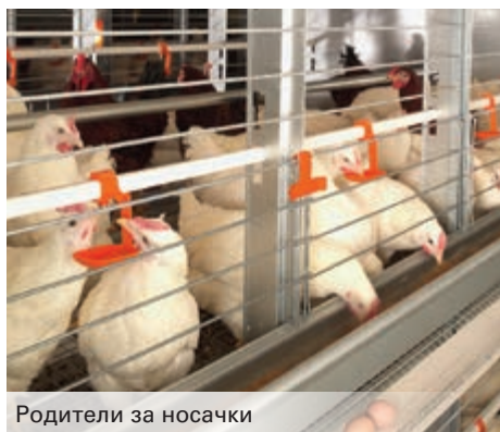
Родители за носачки