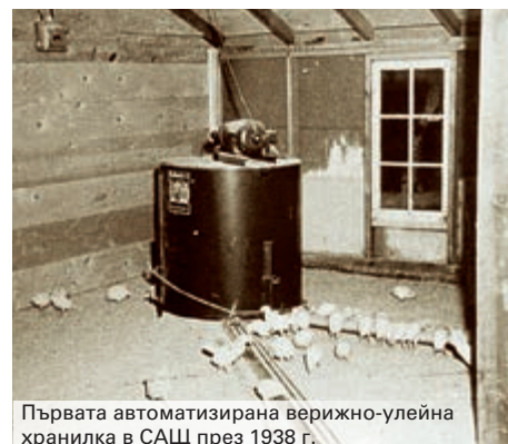
Първата автоматизирана верижно-улейна хранилка в САЩ през 1938 г.

Веригата за подаване на фураж CHAMPION е с универсално приложение, както при продуктивни носачки в клетка и родители за носачки, така и за подрастващи птици от първия до последния ден на отглеждане. Въпросната верига се използва и при подовото отглеждане на родители за бройлери, както и при алтернативните технологии за отглеждане на носачки.