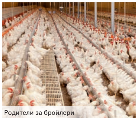
Родители за бройлери