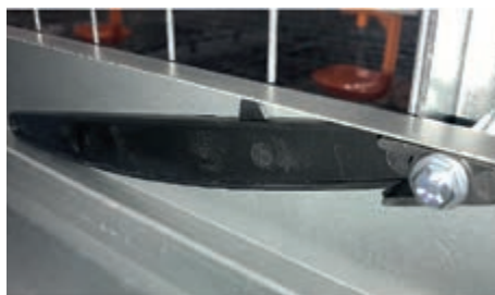
Ya no se producen pérdidas de alimento gracias al nuevo ajuste en altura de las ventanas de alimentación en el piso de cría