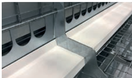
Vista de las ventanas de alimentación en el piso de cría y del carril de estribo de plástico