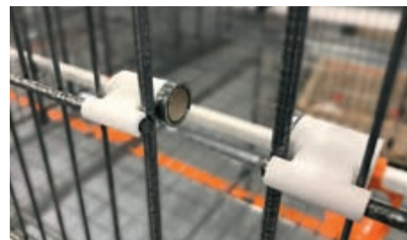
Cierre magnético en las mallas delanteras → cierre seguro