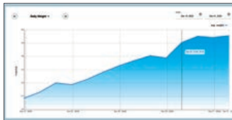
Tägliches Durchschnittsgewicht der Tiergruppe