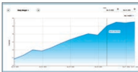
Peso medio diario del grupo de animales