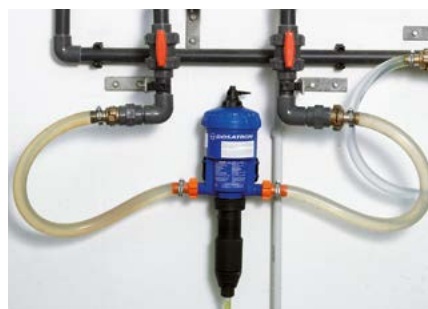
Doseur de médicaments de type 1