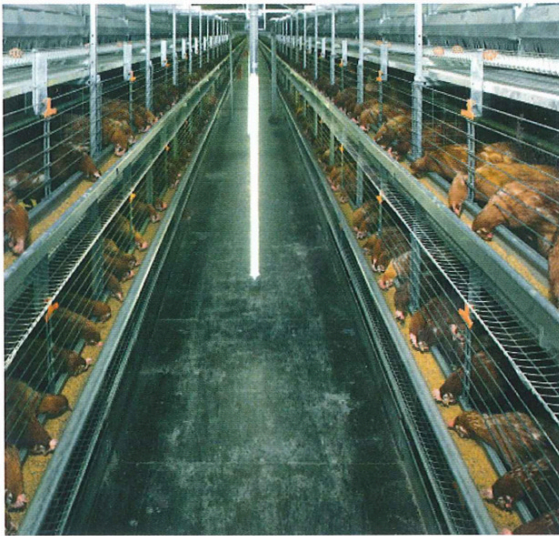
“НАТУРА60”: система с идеальным доступом. Не имеет аналогов в мире: ежесекундный контроль коридоров, остающихся свободными от подстилки, кур и помёта.

Хорватию и до Японии 20 млн несушек содержатся в системах “Биг Дачмен” “НАТУРА”.