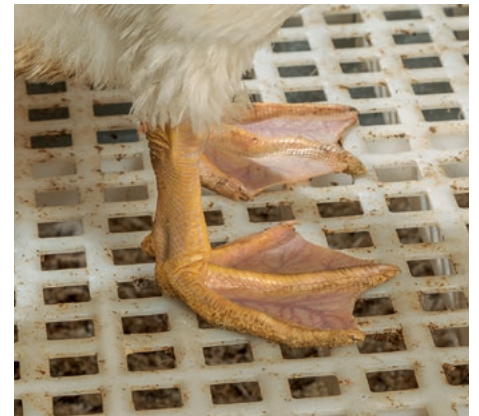
Les déjections liquides peuvent bien s'écouler → de cette façon le caillebotis reste relativement propre jusqu'en fin d'engraissement