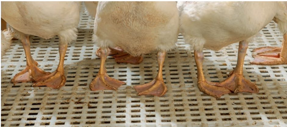
Le caillebotis ne présente ni coins ni arêtes vives. Les traverses larges et la surface antidérapante assurent une stabilité optimale aux canards.

Le nouveau caillebotis plastique BD est disponible en 1200 x 600 mm. Il s'utilise idéalement dans l'élevage et l'engraissement de canards de Barbarie, mulards et Pékin.